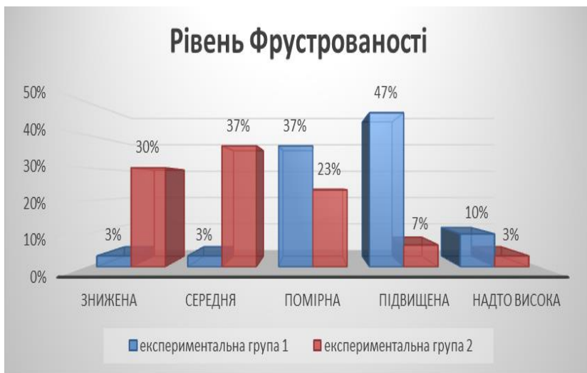
Рис. 1. Порівняльна характеристика рівнів фрустрованості у студентів

проявляють високий рівень самотності. Низький рівень депресії виявлено у 70 % студентів 1 курсу та у 43 % студентів 4 курсу.