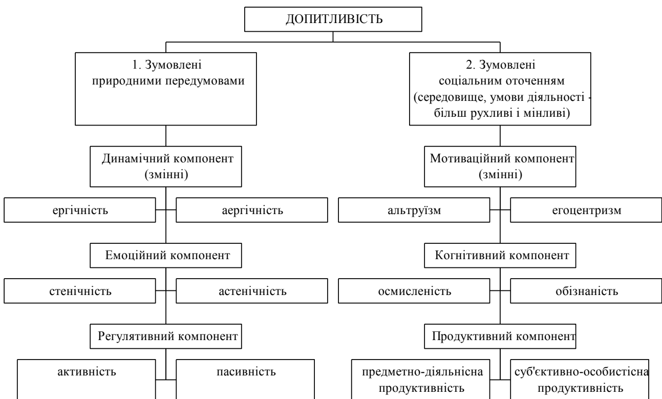
Рис. 1. Структурно-функціональна модель допитливості особистості

На основі цього нами розроблена структурно-функціональна модель допитливості особистості (див. рис. 1).