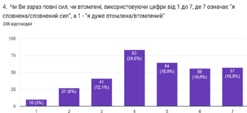
Рис. 2. Стан опитаних перед початком заходу