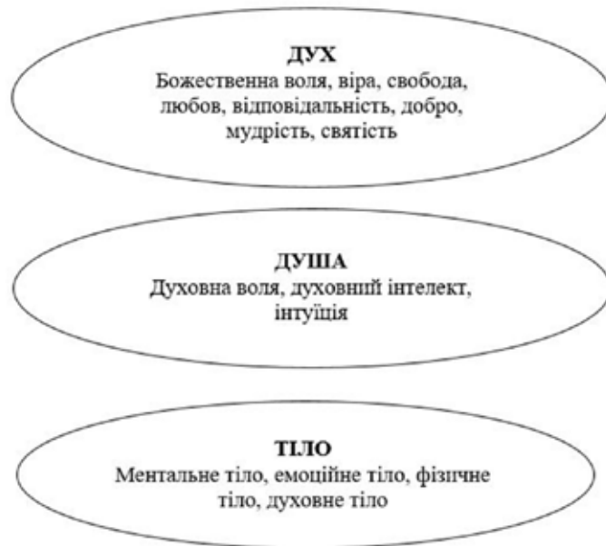
Рис. 1. Духовна тріада

Ментальне тіло є вищим Его, в якому розрізняють три компоненти: розум, інтелект і мислення. Простіше кажучи, ментальне тіло – це структура, яка відповідає за обробку інформації. Тут народжуються наші думки і відбуваються процеси мислення. У ментальному тілі народжуються раціональні думки та ідеї.