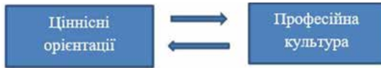
Рис. 1. Зв'язок професійної культури та ціннісних орієнтацій

Ціннісно-сміслові орієнтації майбутнього психолога є базовими особистісними утвореннями, котрі визначають їх спрямованість та зміст професійної культури.