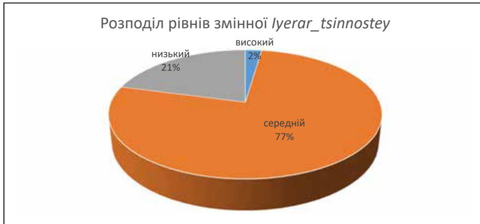
Рис. 2. Рівень духовних потреб майбутніх педагогів

професійних намірів з особистими, сімейними, життєвими, знаннями. Такі студенти прагнуть до реалізації ідей духовності у повсякденному житті та гармонізації особистого життя з життям інших людей, де всі справи, слова, дії спрямовані у русло духовних цінностей, загальнолюдської моральності.